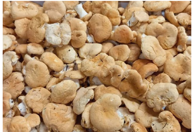
Semmel-Stoppelpilz Hedgehog Mushroom