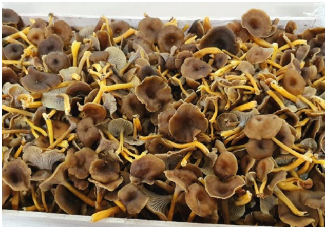
Trompetenpfifferling Funnel Chanterelle