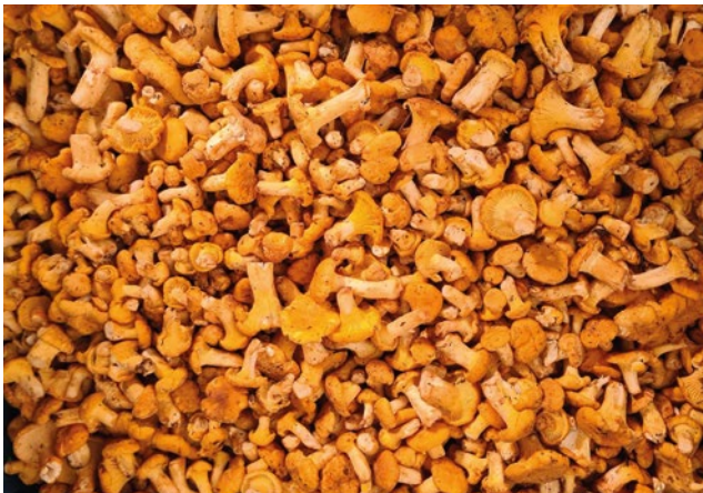
Eierschwämme Golden Chanterelle