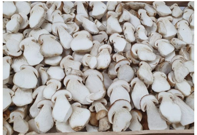
Steinpilze Porcini mushrooms