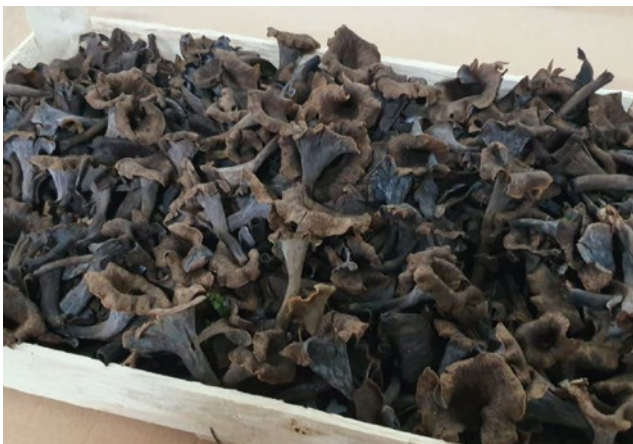
Herbsttrompete Black Chanterelle